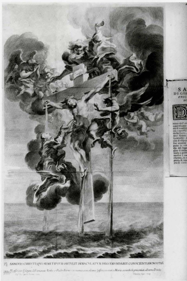
1. Gian Lorenzo Bernini Sangue di Cristo Incisione di François Spierre, frontespizio del libro di F. Marchese, Unica speranza del peccatore , Roma 1670 Città del Vaticano, Biblioteca Apostolica Vaticana

ca cosa alcuna, l'offerisco a voi, o Maria, accioche lo presentiate all'aeterna Trinita. Eq.s Io. Lauren. Bernini inuen. Franciscus Spier Sculp."