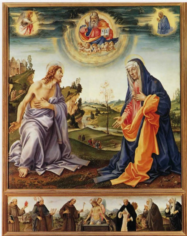
3. Lorenzo Monaco (attr.) Doppia intercessione , ante 1402 New York, The Metropolitan Museum of Art, Cloisters