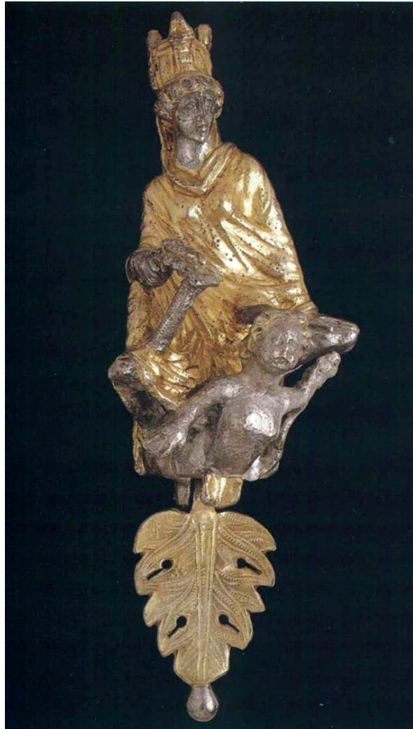
FIG. 4. – Antioche.

s'estimaient étrangers en Italie, tout comme le reste du monde méditerranéen. Nous pouvons raisonnablement examiner la résonance du nom romain en Orient dans l'Antiquité tardive en référence à ce problème fondamental de l'identité romaine. La légende de l'arrivée d'Énée sur les côtes du Latium ne laissait aucun doute à ce propos :