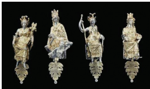
FIG. 1. – Tychai du « trésor d'argenterie » de l'Esquilin.

[Philothée], sous sa forme grecque) du monastère Éléazar de Pskov écrivit au tsar Vassili III : « Deux Rome sont tombées, mais la troisième demeure, et il n'y en aura jamais de quatrième 4 . » Cette déclaration apocalyptique adressée au souverain de Moscou affirme que sa ville n'est pas seulement la ville du tsar, Tsargrad, mais Rome, la Troisième Rome. À en croire Filofeï, le renom et la gloire, par quoi il désignait la capitale de la Chrétienté, avaient de longue date déserté la Rome italienne, d'où ils étaient passés à Byzance, qui prit le nom de Constantinople et devint la Deuxième Rome. Avec la chute de cette grande ville du Bosphore devant les Turcs ottomans en 1453, un peu plus d'un demi-siècle avant la lettre de Filofeï, cependant, Moscou pouvait désormais revendiquer le nom antique et tout ce qu'il impliquait. Le moine avait raison. Il n'y a jamais eu, et il n'y aura vraisemblablement jamais, de Quatrième Rome.