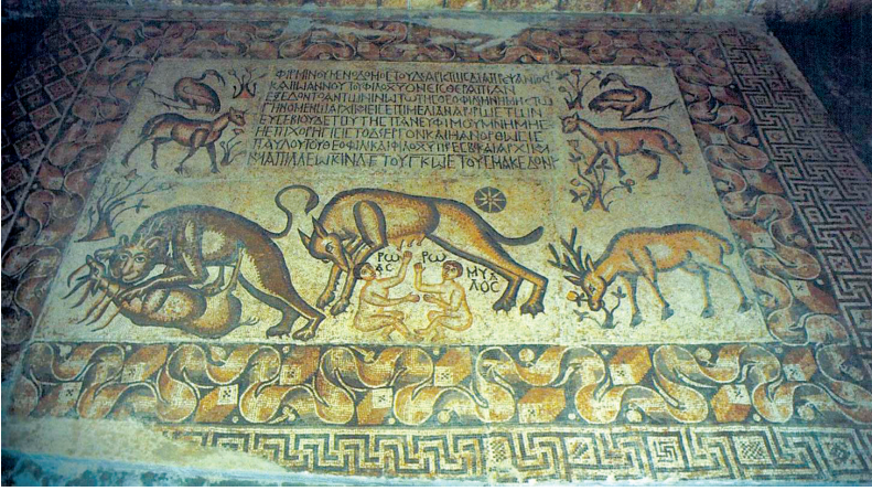
FIG. 7. – Mosaïque de Syrie.

dans la mémoire collective desquels Rome restait la puissance qui avait conquis par deux fois Jérusalem, n'en durent pas moins prendre acte de la force persistante du droit romain à leur époque et, dans cette mesure, tenir compte de l'ancienne Rome 31 . Les grands codes de Théodose et de Justinien devaient consacrer l'appropriation du droit romain par l'Empire byzantin, si bien que c'est en définitive dans cette seule sphère que le mot romain continua en Orient à trahir son origine italienne.