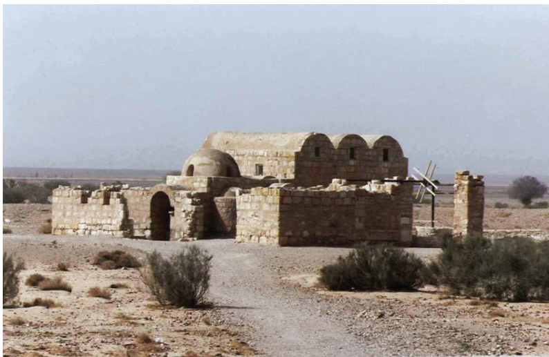
FIG. 11. – Château de Qusayr al-'amra.