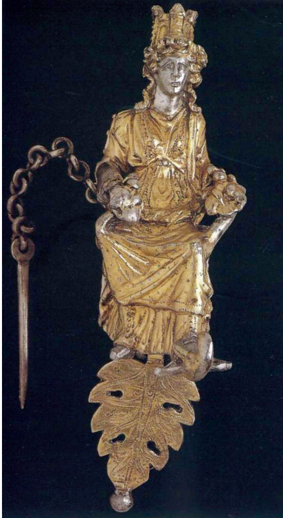
FIG. 5. – Alexandrie.

ses camarades et lui étaient des réfugiés de Troie et de la guerre de Troie.