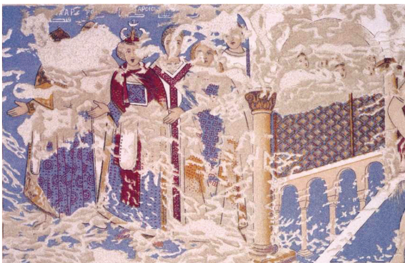
FIG. 12. – Fresque représentant six grands « maîtres du monde ».