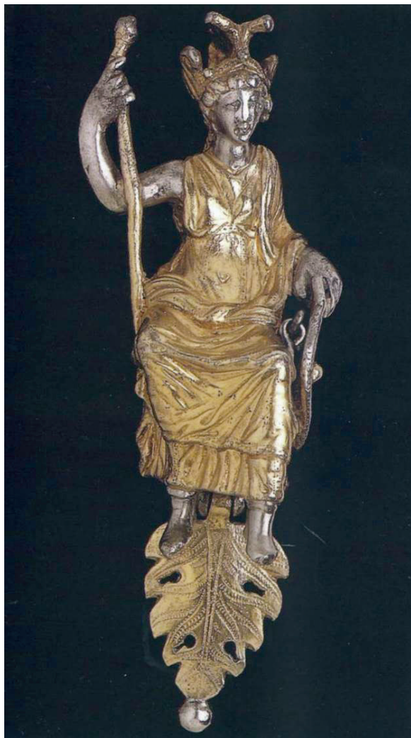
FIG. 2. – Rome.

la capitale chrétienne, ce qui permit à Moscou d'en revendiquer l'appellation au nom de la chrétienté orthodoxe.