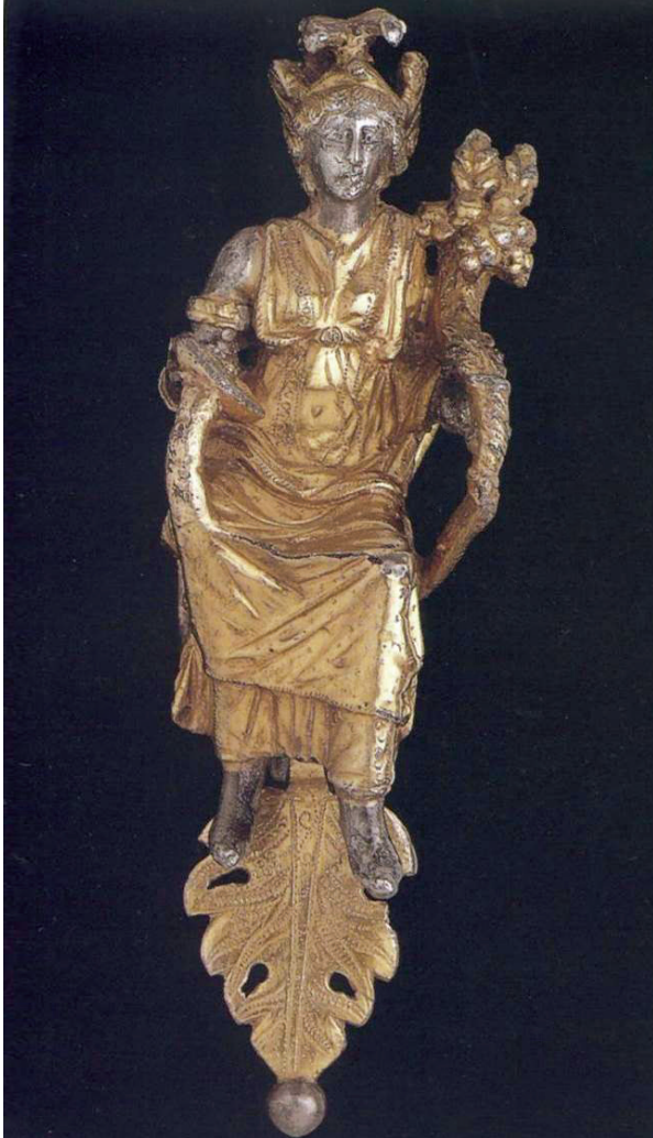
FIG. 3. – Constantinople.

Rome mais déplaça en Orient les prétentions impériales de la ville. Ce faisant, il transforma involontairement en réalité les peurs les plus sombres de la Rome augustéenne. Après la défaite de la reine égyptienne Cléopâtre à Actium, en 31 avant notre ère, les Romains avaient en effet voulu prouver que somme toute, ils n'étaient pas une nation décadente originaire de Méditerranée orientale. Mais ils n'avaient pas la tâche facile. Malgré leur nom, les Romains