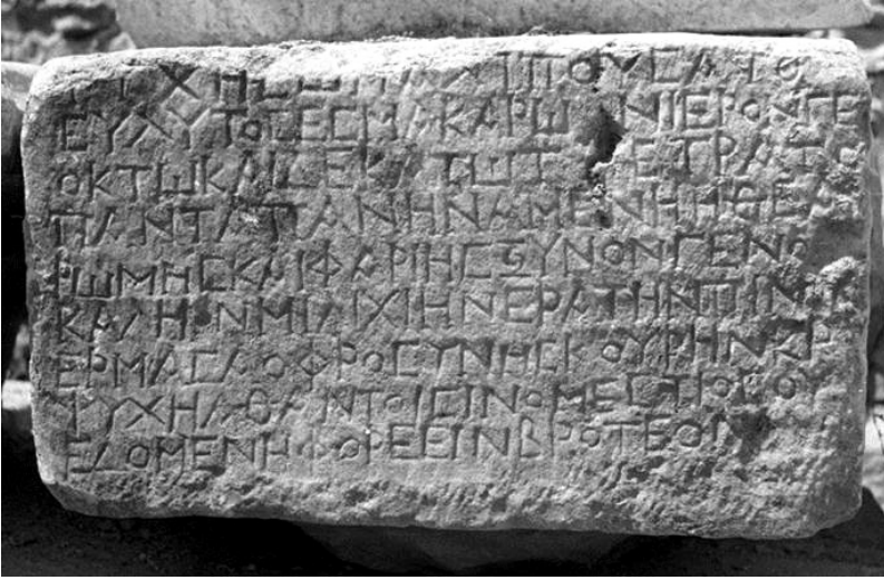
FIG. 6. – Inscription d’Aphrodisias mentionnant une jeune fille originaire de Ῥώμης.

par les mots Ῥώμης (Rome, i. e. Constantinople,) καὶ Φαρίης, et Alexandrie 23 . On retrouve exactement la même expression, avec le même sens, chez Agathias ( Anth. Pal. 7, 612) 24 . Il est clair que cet usage avait essaimé en Méditerranée orientale et jeté les fondations de Rum et autres mots apparentés pour désigner Constantinople et les Grecs byzantins non seulement en grec mais aussi en d’autres langues telles que le syriaque, l’éthiopique et l’arabe.