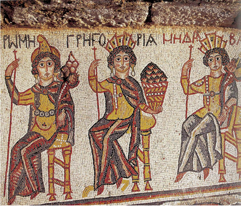
FIG. 9. – Détail : trois tychai de villes.