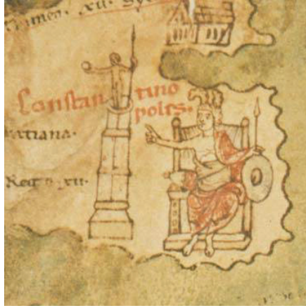
FIG. 10. – Constantinople dans la Table de Peutinger.

tout simplement Constantinople. Quand les califes omeyyades se retirèrent dans les délices de leur château de Qusayr al-'amra en plein désert dans l'actuelle Jordanie (fig. 11), ils y trouvèrent, peints sur le mur, les images des six grands maîtres du monde (fig. 12). Chacun était identifié par un nom ou un titre, tant en arabe qu'en grec : l'empereur byzantin, le Chosroès perse, le négus éthiopien et deux autres, dont les étiquettes ont disparu : peut-être l'empereur de Chine et, au vu des contacts entre Arabes et Khazars, le Kh'q'n d'Asie centrale. Il n'y avait qu'une figure pour évoquer la Méditerranée occidentale : Rodéric, le dernier roi wisigoth de Sicile, dont on a imaginé que le nom avait survécu dans les deux langues de la fresque, mais je suis convaincu que le nom a été mal lu ; l'incertitude demeure quant à l'identité de ce souverain 34 . Nous sommes malheureusement tributaires aujourd'hui des mauvaises copies de ces images endommagées réalisées par les explorateurs autrichiens Musil et Mielich au début du siècle dernier. Un point n'en demeure pas moins incontestable : pour les Arabes de cette époque et de cette