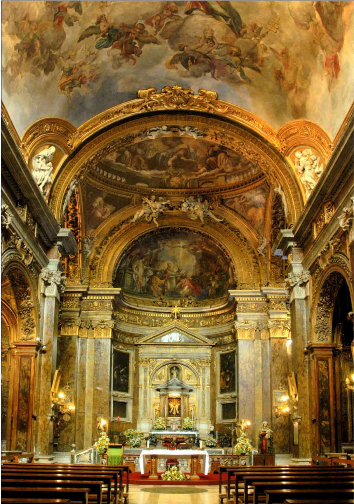
Fig. 2 S. Silvestro in Capite: interior