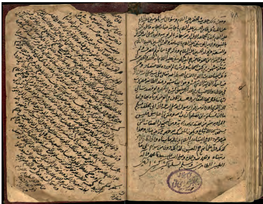
FIGURE 4 MS Tehran, Majlis 7539, fol. 78a