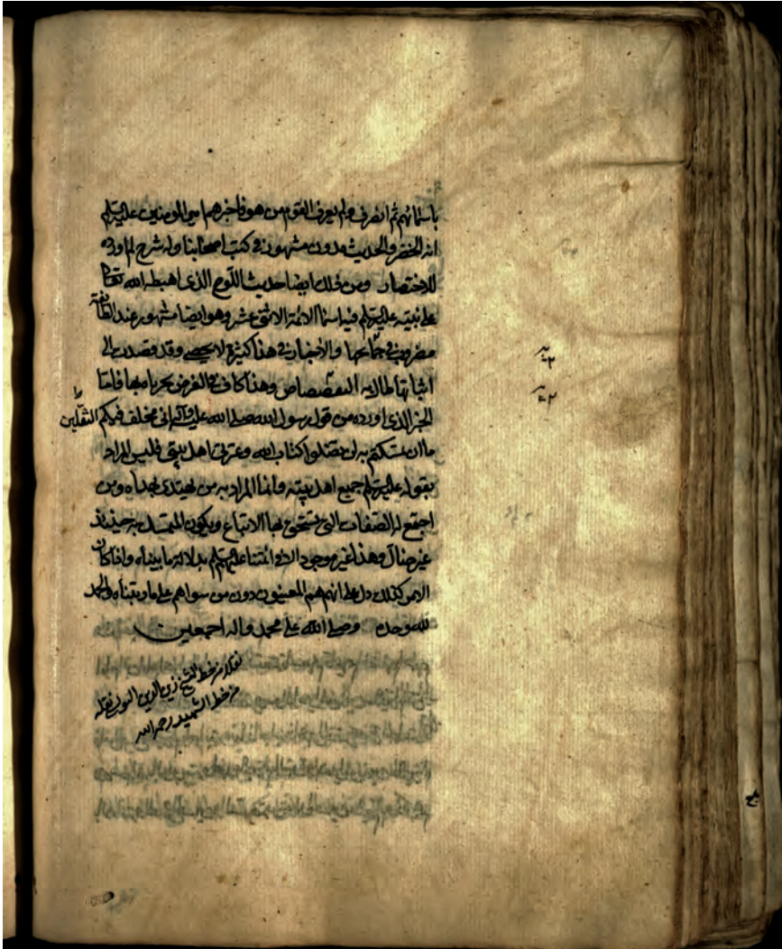
FIGURE 2 MS Tehran, Dānishgāh-i Tihirān 5396, fol. 225v

Interestingly, in this manuscript the tract is preceded by a text block consisting of four responsa by al-Sharīf al-Murtaḍā (fols 211v–221v), namely al-Man‘ min tafḍīl al-malā’ika ‘alā l-anbiyā’ (fols 211v–215v), 34 Mas’ala fī ‘illat imtinā’